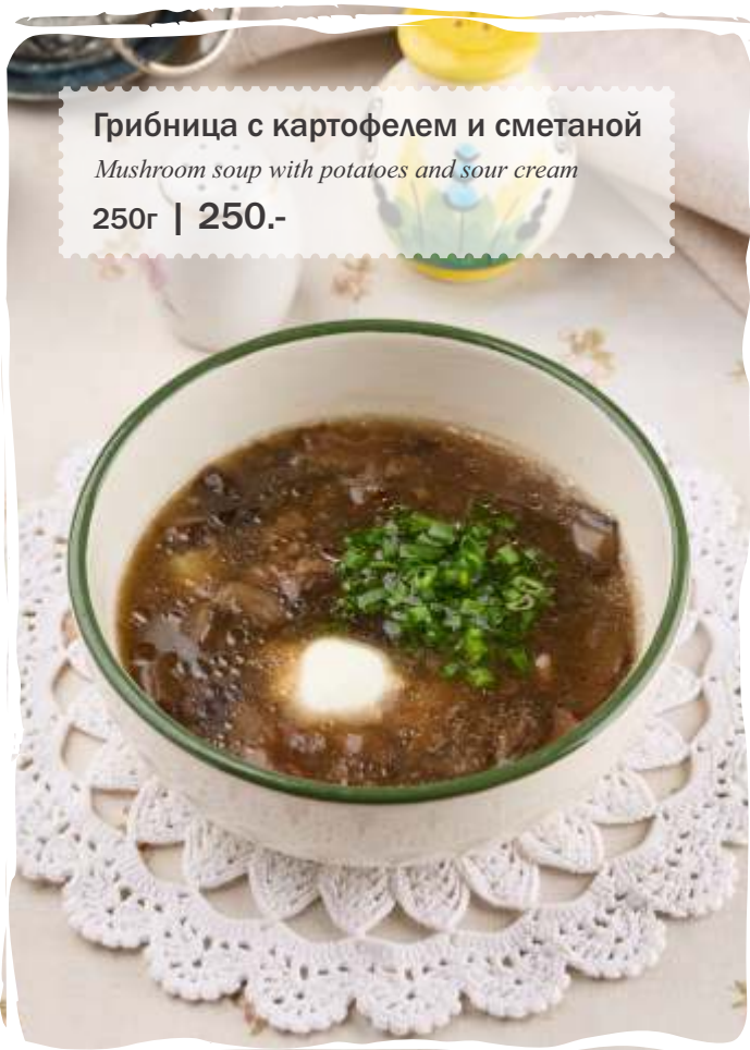
Грибница с картофелем и сметаной

Mushroom soup with potatoes and sour cream