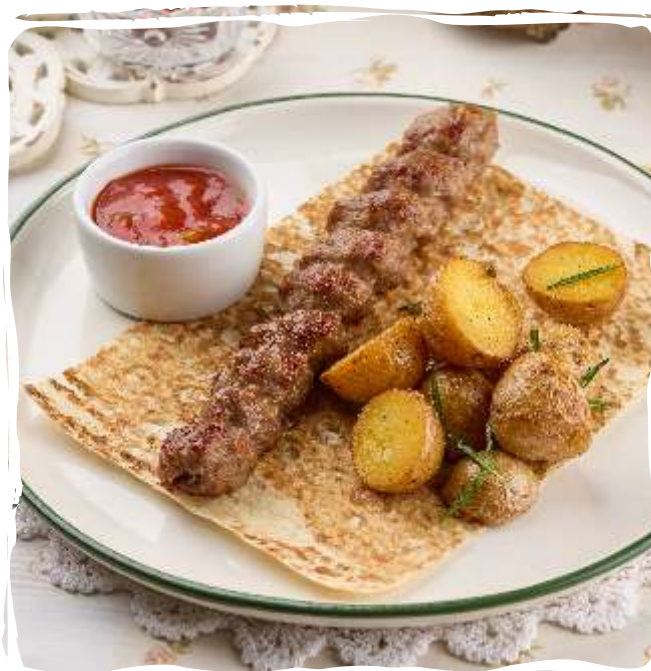
Кебаб из баранины с молодым картофелем