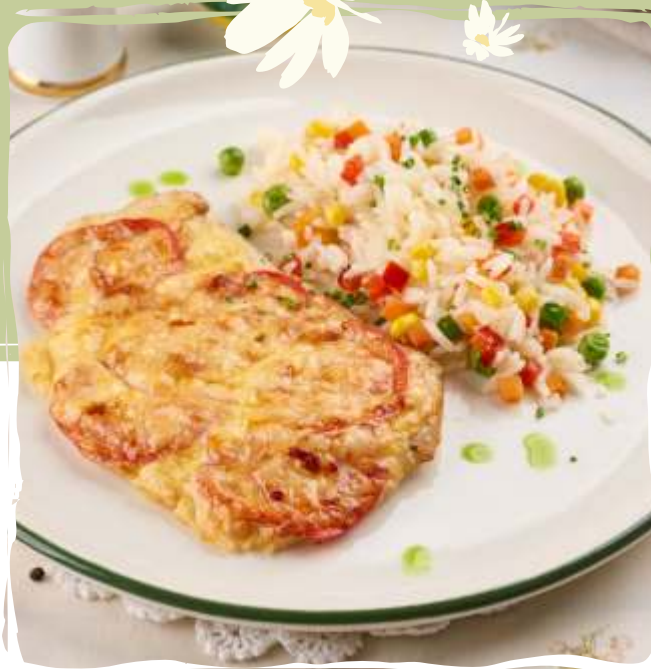
Куриное филе под сыром с рисом и овощами

Chicken fillet topped with cheese, served with rice and vegetables