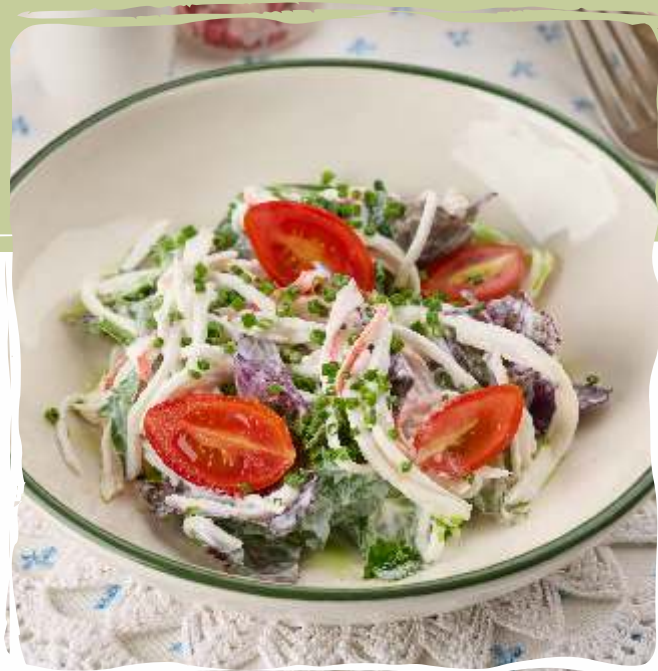
Салат со "снежным крабом" и сметанной заправкой

Salad with ripe tomatoes and brynza cheese