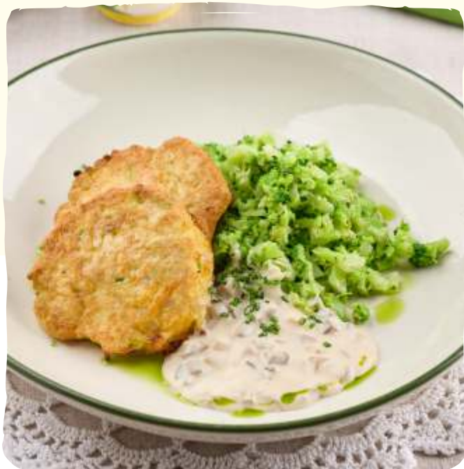
Оладьи из индейки с брокколи и грибным соусом

Turkey fritters with broccoli and mushroom sauce