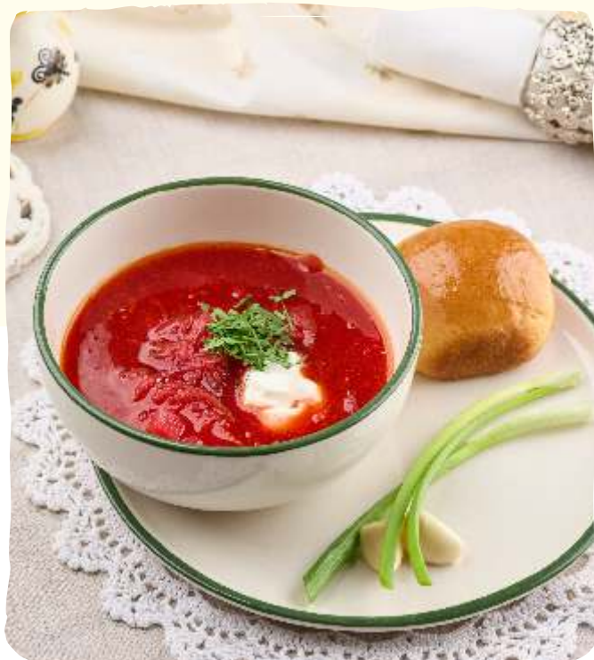
Борщ с куриным филе и пампушкой