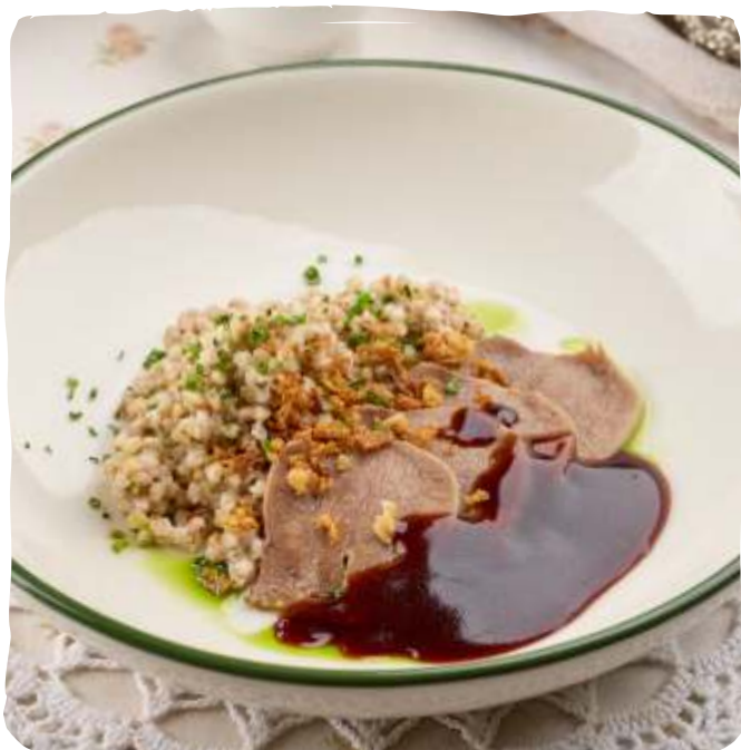
Томлёный говяжий язык с зелёной гречей

Braised beef tongue with green buckwheat