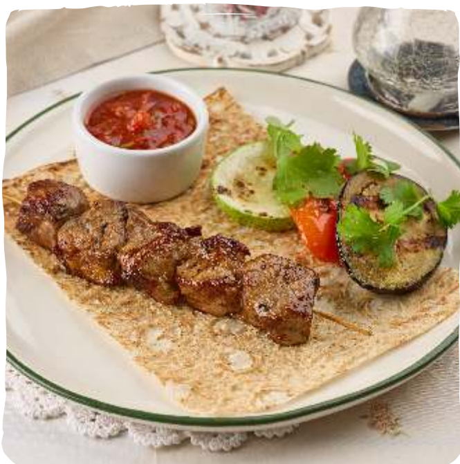
Шашлычок из свиной шеи с овощами гриль

Pork neck skewer with grilled vegetables