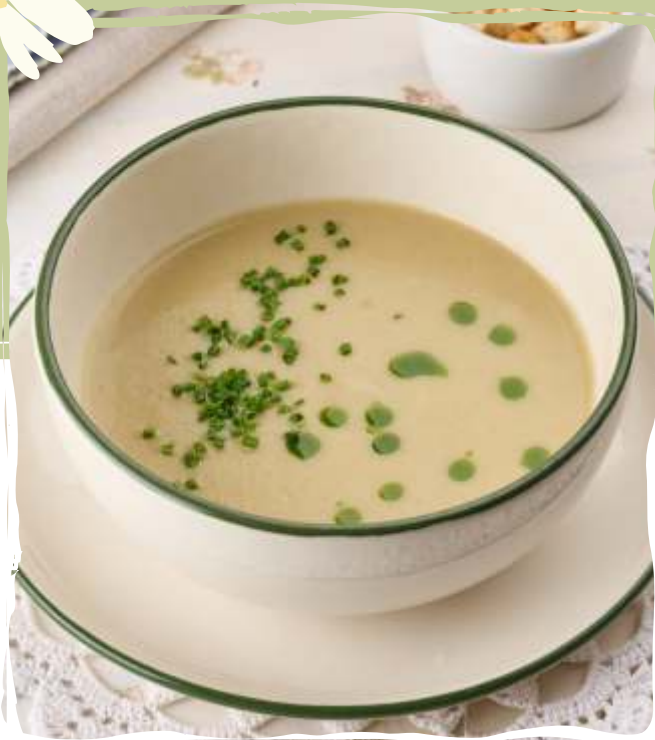
Крем-суп из шампиньонов с гренками