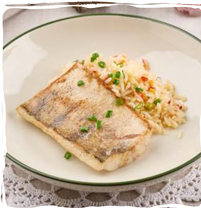
Обжаренное филе судака с рисом и овощами

Seared pike perch fillet with rice and vegetables