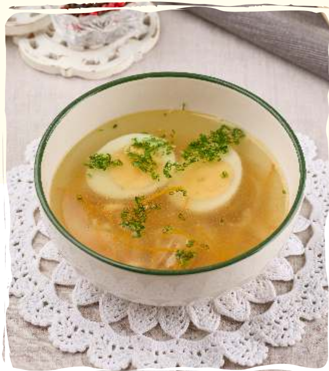
Куриный бульон с яйцом

Borscht with chicken fillet and garlic bun