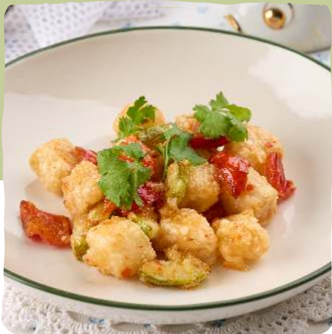
Филе белой рыбы с овощами в соусе «Сладкий чили»

White fish fillet with vegetables and sweet chilli sauce