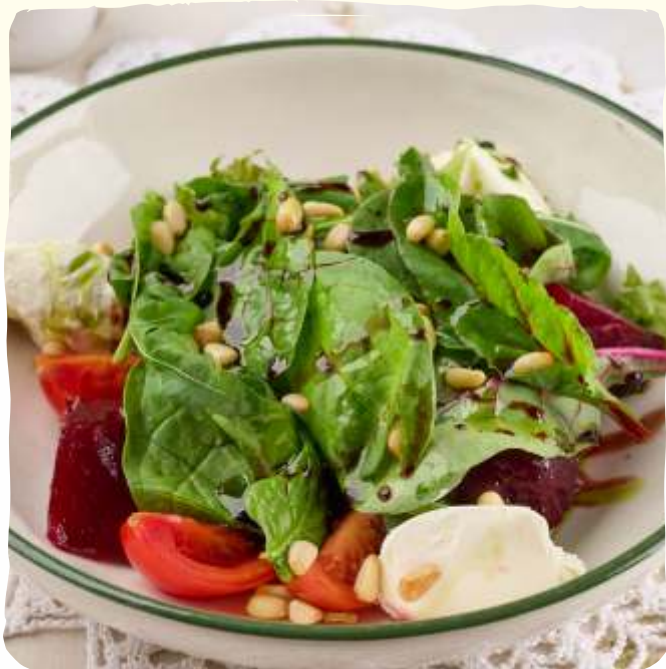
Салат с медовой свёклой и сливочным сыром