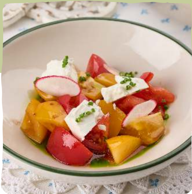
Салат со спелыми томатами и брынзой