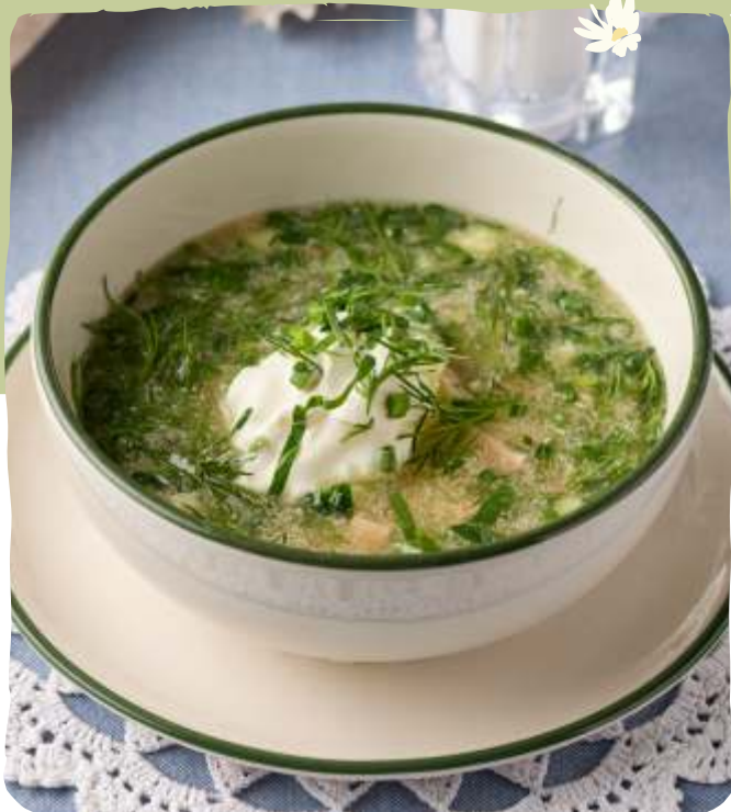
Окрошка на квасе с куриным филе