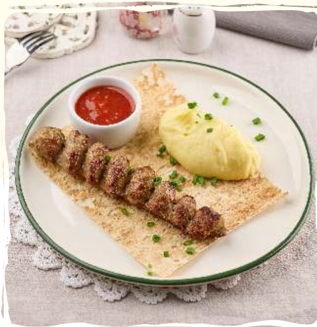
Кебаб из телятины с картофельным пюре и томатным соусом

Veal kebab with mashed potatoes and tomato sauce